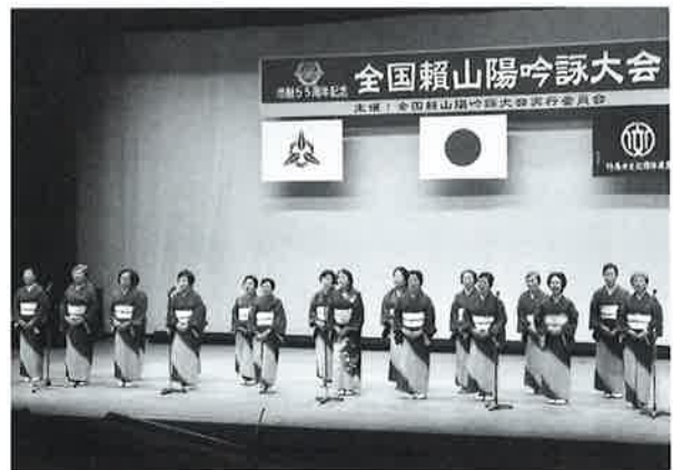
全国頼山陽吟詠大会