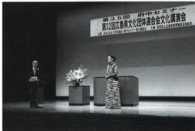
文化講演会（府中セミナー）