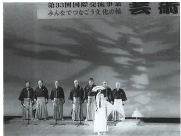
第33回国際交流事業 東広島市芸術祭