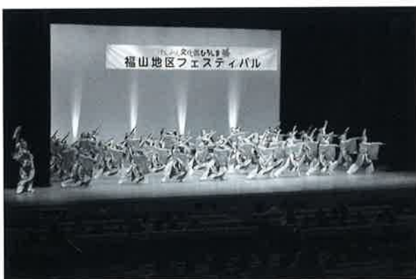
けんみん文化祭ひろしま'15 福山地区フェスティバル (府中市文化センター)

少子高齢化・人口減少が進む中で、地域住民同士のつながりの重要性が見直されている昨今、私たちは文化・芸術活動を通じて市民の心豊かな生活の実現に向けて一役を果たしていきたいと感じております。