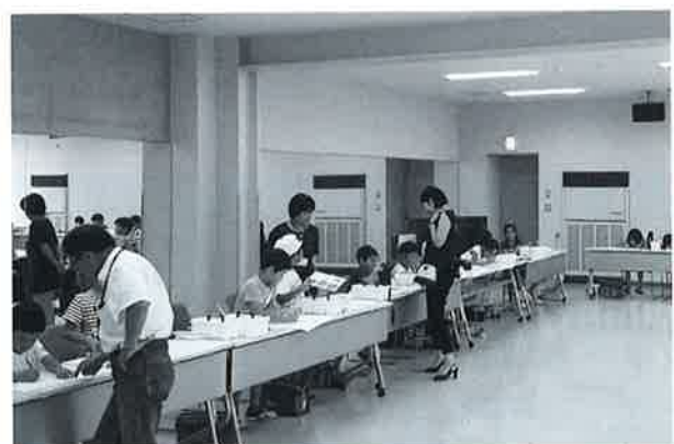
会員によるこども絵画教室での指導