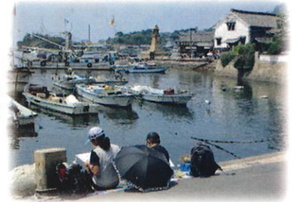
昨年度 絵画教室の様子(福山市鞆の浦)