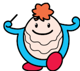
けんみん文化祭ひろしま マスケットキャラクター ブンカッキー